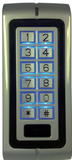
➤ ABMATIC 5101