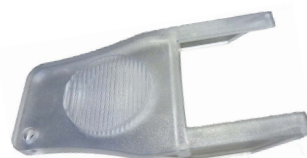
Clé de réarmement - ACA3678