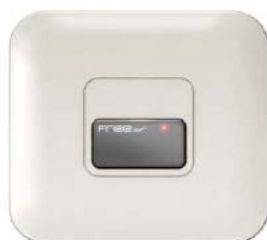
Antenne 3 m

En effet lorsque vous vous approcher de l'antenne, l'émetteur radio que vous portez sur vous ou dans votre véhicule transmet un signal au récepteur (jusqu'à 100 m) qui délivre le contact d'ouverture.